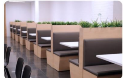
Edificio Biblioteca (B) THE FAST GOOD