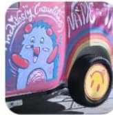
Name the Truck Foodtruck