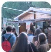
La Cabaña Foodtruck