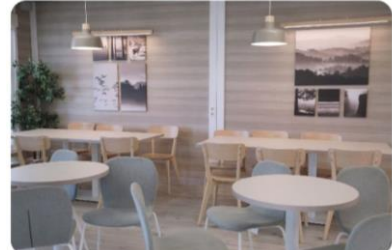
Edificios O-P THE CORNER