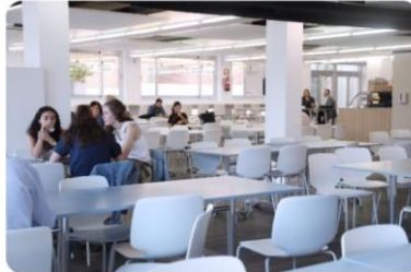
Edificio Central THE MARKET