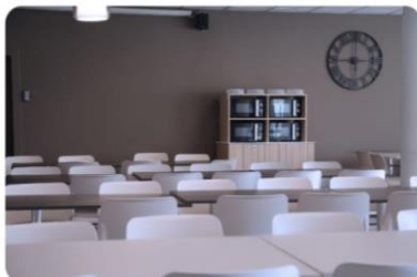
Colegio Mayor THE HOME