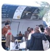
La Rollerie Foodtruck