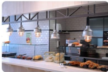
Centro Deportivo (CD) THE CLUB