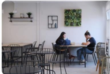
Edificio M THE GARDEN