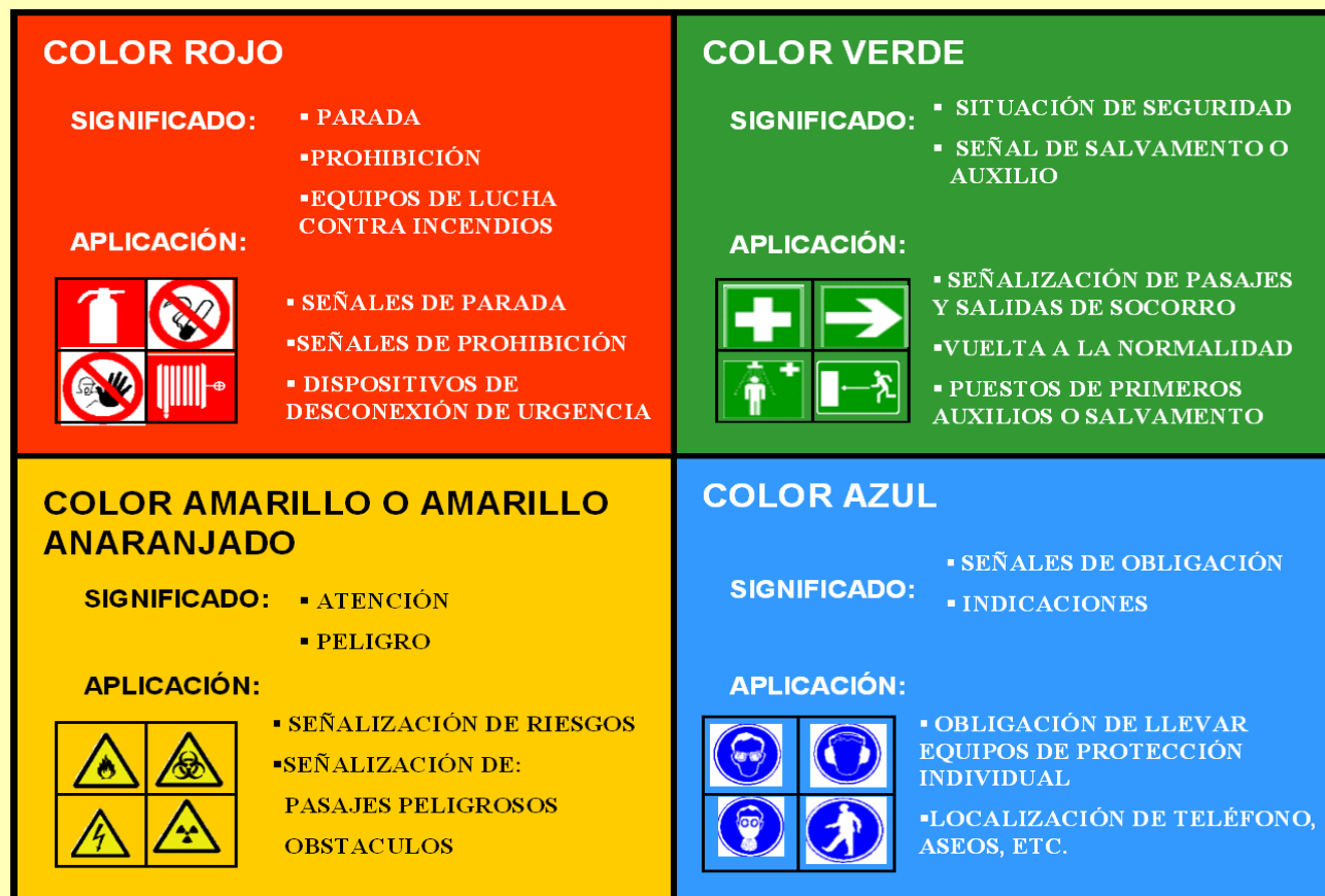
Tabla 1. Señalización de seguridad.

Advertir la presencia de un riesgo , recordar una prohibición u obligación :