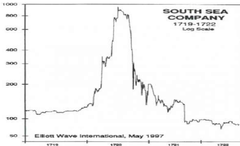
Figura 2. Evolución del precio de las acciones de la South Sea Company: 1719 -1722

Fuente: Elliot Wave International (1997).